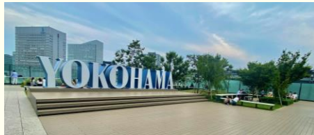
SNSで有名なYOKOHAMAオブジェ