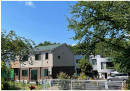
鶴ヶ峰もえぎ(外観)