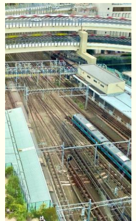
高速道路と電車と きれいな青空と横浜の海 (運が良ければ船も?)が 同時に見れます！